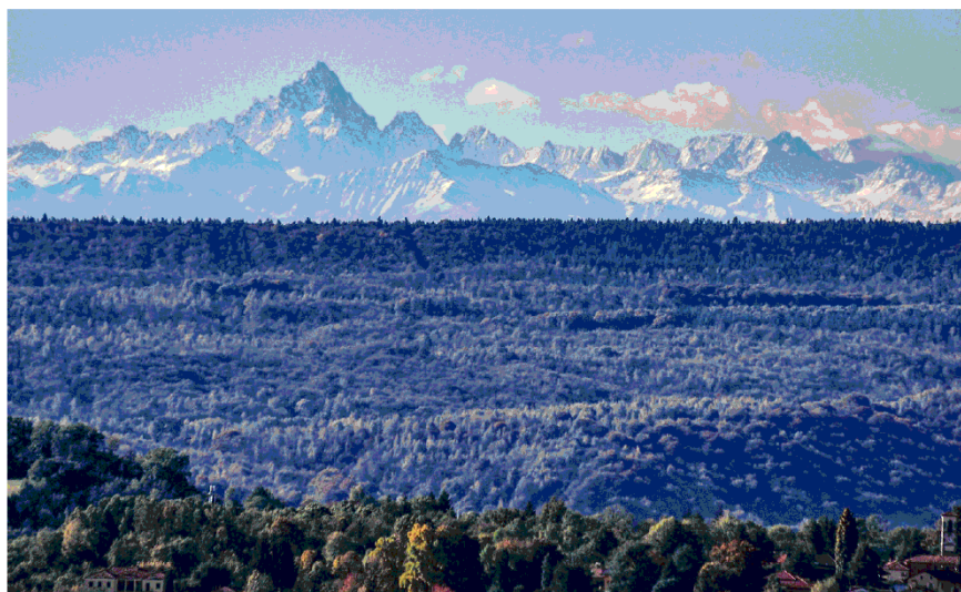
IL MONVISO VISTO DALLA BURCINA