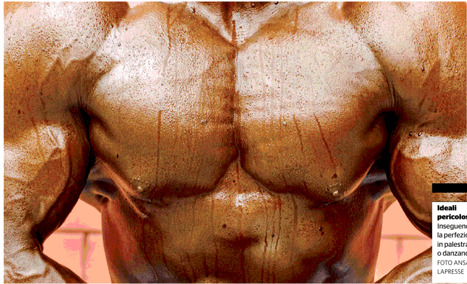
Ideali pericolosi Inseguendo la perfezione in palestra o danzando

ghettizzati come fenomeni da baraccone diventavano seduttivi. Se prima le palestre raccoglievano gli scarti della società, perché sollevare pesi era un modo per emanciparsi, con il futuro divo di Hollywood comincia una stagione glamour. Tuttavia - basta guardare alle parabole degli atleti che competono per la palma di Mr. Olympia - i corpi abnormi sono reputati sinistri o fatui, vocati a una spirale di autodistruzione (capitata per esempio al brasiliano Segato , star di TikTok, morto a 55 anni perché si iniettava olio nei muscoli per gonfiarli a dismisura).