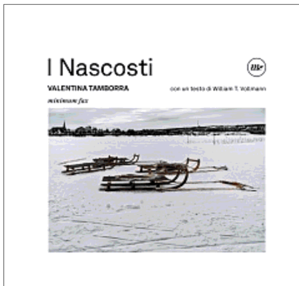
Valentina Tamborra, I Nascosti , minimum fax, 167 pagine, 35 €