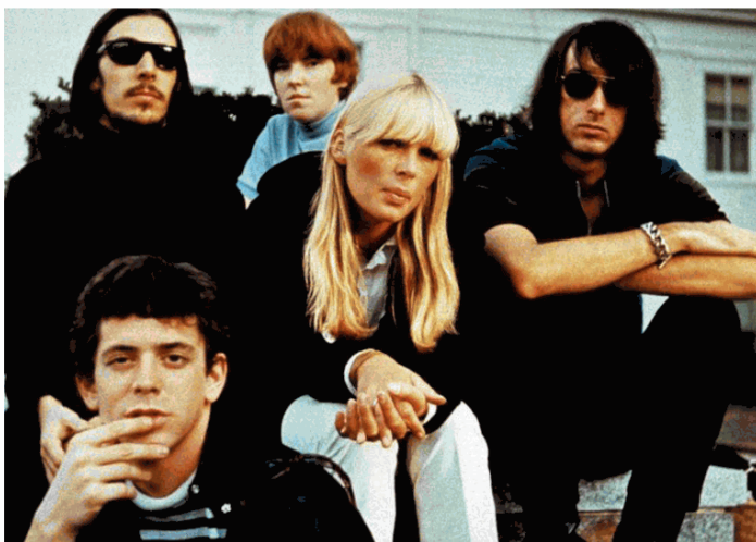
Il Velvet Underground. Da sinistra, dietro: Sterling Morrison Moe Tucker. Davanti: Lou Reed, Nico, John Cale

e una fila di provette piene d'acqua con delle pillole bianche che si scioglievano in bolle lattiginose». Il libro fa emergere anche i suoi tratti caratteriali, anche in questo caso, rappresentazione di un contrasto difficilmente conciliabile: in pubblico umanamente scostante, sprezzante, protagonista di episodi censurabili nei confronti di giornalisti, fan, colleghi, collaboratori, oltre ogni regola di educazione e di normale rapporto sociale. Cui faceva da contraltare una persona generosa, disponibile, riflessiva, amabile in contesti più intimi. Le forti dipendenze da varie sostanze e la malattia che gli comportò un declino fisico (e mentale) drastico furono in buona parte la causa di certi atteggiamenti.