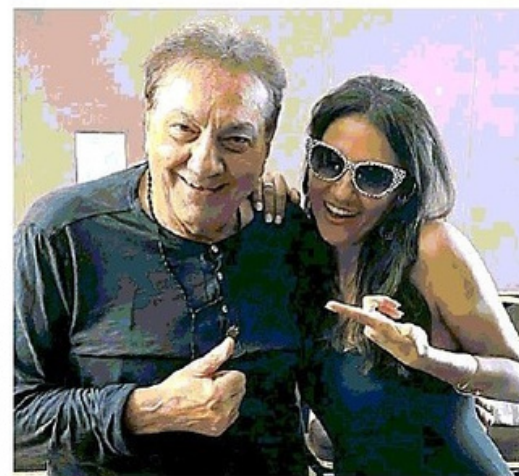
IL PERSONAGGIO Giornalista esperta di musica, conduttrice e ideatrice di eventi: nella foto in alto insieme con Tullio De Piscopo