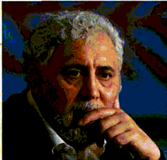
FRANCESCO PICCOLO LA BELLA CONFUSIONE