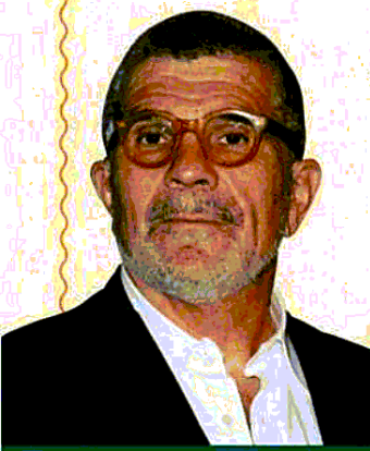
A sinistra: David Mamet. A destra: Francesco Piccolo. Sotto: Mercedes Ron.