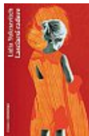
LIDIA YUKNAVITCH Lasciarsi cadere Traduzione di Alessandra Castellazzi NOTTE TEMPO Pagine 208, € 17