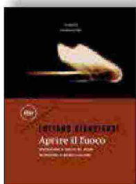
Le copertine dei libri di Bianciardi editi da Ex Cogita, Minimum Fax

«Ho scelto di star dalla parte dei badilanti e dei minatori della mia terra», scriveva Luciano Bianciardi nel '52 sulla rivista Belfagor