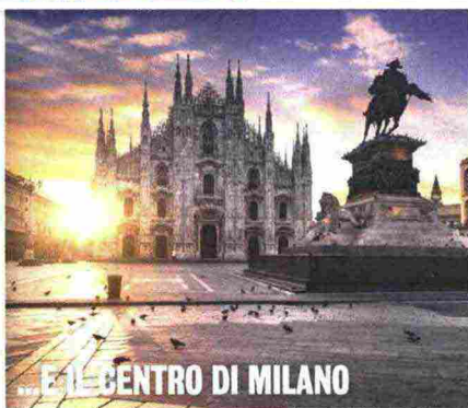
...E IL CENTRO DI MILANO

perversa da millenni le donne sono state tenute relegate mentre gli uomini hanno fatto squadra. Il risultato è sotto gli occhi di tutti».