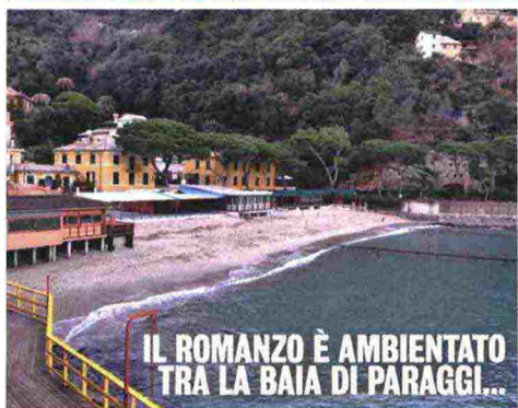
IL ROMANZO È AMBIENTATO TRA LA BAIÀ DI PARAGGI...