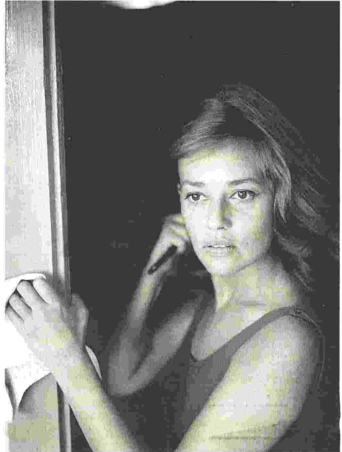
Jeanne Moreau alla Mostra del cinema di Venezia nel 1961

sta, pogrom antiebraici, lotta partigiana, guerra ai civili, stragi, deportazioni, fabbriche della morte come la Risiera di San Sabba, foibe, sradicamento di intere comunità nazionali. Un grande storico, ben oltre l'ottica parziale all'interno di una storia nazionale (italiana, slovena, croata), offre una panoramica complessiva delle logiche della violenza che hanno avvelenato - non solo al confine orientale - l'intero Novecento. Amaramente necessario.