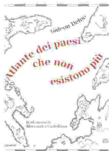
"L'Atlante di Gideon Defoe"

Ci sono nazioni scomparse per ragioni politiche, come la Jugoslavia o la Repubblica Democratica Tedesca. Ma la Storia è anche ricca di paesi dissolti per eventi bizzarri, imprevedibili, tragici e, spesso, ridicoli. La Repubblica di Cospaia, il Regno celeste della grande pace, la Grande Repubblica di Rough & Ready, il Regno dorato di Silla, il Libero stato del collo di bottiglia, la Repubblica sovietica dei soldati e costruttori di for-