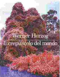
"Il crepuscolo del mondo"