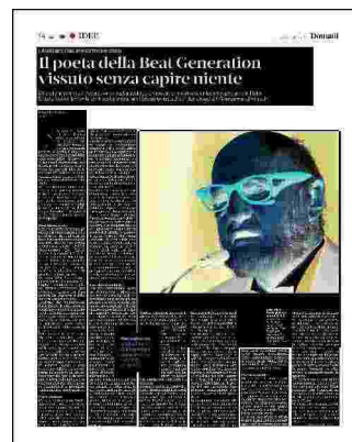
Lawrence Ferlinghetti è nato nel 1919 a Yonkers, nello stato di New York, era figlio di un bresciano emigrato. È morto lunedì a San Francisco.

In quegli anni, San Francisco stava vivendo un'epoca di fioritura