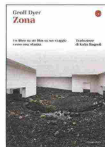
Geoff Dyer, Il Saggiatore , Pagg. 192, € 24,00

● La vita come un romanzo russo? Di più, "un libro su un film su un viaggio verso una stanza", che il sommo Geoff Dyer dedica al film della sua vita e della sua ossessione, estetica, Stalker di Andrej Tarkovskij. È pieno di intelligenza, fulmina per quanto lo è, sotto la voce (auto)ironia ridà alla critica la carne viva, al film un vissuto inedito, in cui i fotogrammi imbarcano infanzie, trip, amore e perversione. Sopra tutto, distilla considerazione spaziotemporale da resuscitare Deleuze e far impallidire Tenet e molti Nolan ancora. Che libro.