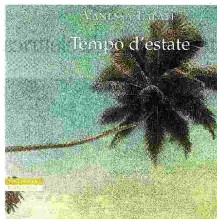
Ambientato negli Usa anni '30, per Neri Pozza