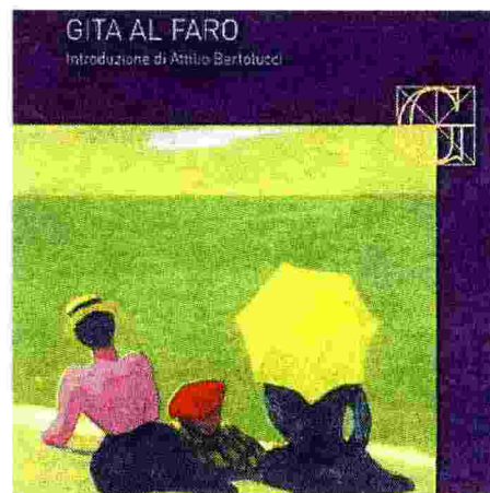
Sull'Isola di Skye, nelle Isole Ebridi, con la Wolf