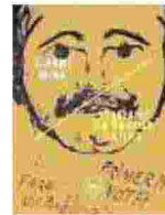
GIANNI MINÀ STORIA DI UN BOXEUR LATINO MINIMUM FAX PAGINE 232 EURO 16

TRA I RICORDI A KINSHASA PER ALI-FOREMAN ANGELO DUNDEE URLÒ: «FATELO PASSARE CHILLO È FRATE MIO» L'AMICIZIA CON MENNEA IL CALCIO CON MORANDI