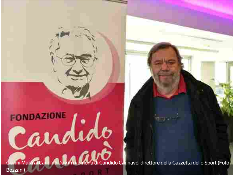
Gianni Mura al Candido Day in memoria di Candido Cannavò, direttore della Gazzetta dello Sport

Si sentiva in forma, stava seguendo gli ordini dei medici. Un colpo al cuore l'ha portato via mentre respirava quell'aria buona che i dottori gli avevano consigliato, per superare i postumi della polmonite che ancora non si chiamava Covid-19.