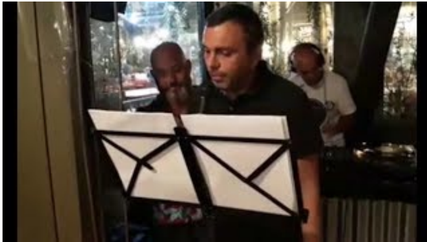
Presentazione 'NO!IA e altri antidoti al tedio vivere' - Haus Garten - Roma 20.9.2019