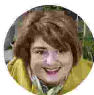
a cura di Maria Laura Labriola