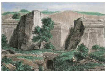
Norchia in una stampa del 1850

https://twitter.com/amicidinor ( https://twitter.com/amicidinor