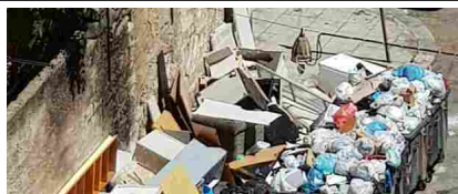
palermomania.it - Discarica perenne in via mendola *segnalazione*

*Fabio Zuffanti (1968) è un musicista e scrittore genovese. Ha una lunghissima discografia alle spalle, solista e con gruppo quali Finisterre, Maschera di cera e Hostsonaten. Ha pubblicato numerosi libri, l'ultimo dei quali è una biografia di Franco Battiato, La voce del padrone (Arcana). Il suo ultimo album è In/Out.