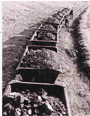
◀ La miniera Foto al centro: una veduta del pozzo Raffa a Ribolla con alcuni operai in primo piano A sinistra: convoglio per il trasporto della lignite Sotto: un minatore di Ribolla Tutte le immagini sono degli anni '40 del Novecento