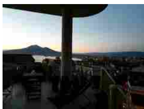
'Mare Mio' al B&B 'Occhi di Mare'