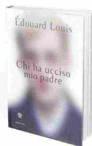
Chi ha ucciso mio padre, di Édouard Louis, Bompiani. Traduzione di Annalisa Romani. Pagg. 96, 14 €

Il padre che adoravi e temevi muore e il suo lascito più cospicuo consiste in otto quintali di pornografia: per anni aveva nascosto la doppia vita di romanziere hard. Ti chiami Chris Offutt e accetti con dolore di riconciliarti scrivendo un capolavoro tenero e spiazzante: Mio padre, il pornografo (Minimum Fax, traduzione di Roberto Serrai. Pagg. 300, 18 €). ☺ _ (Michele Neri)