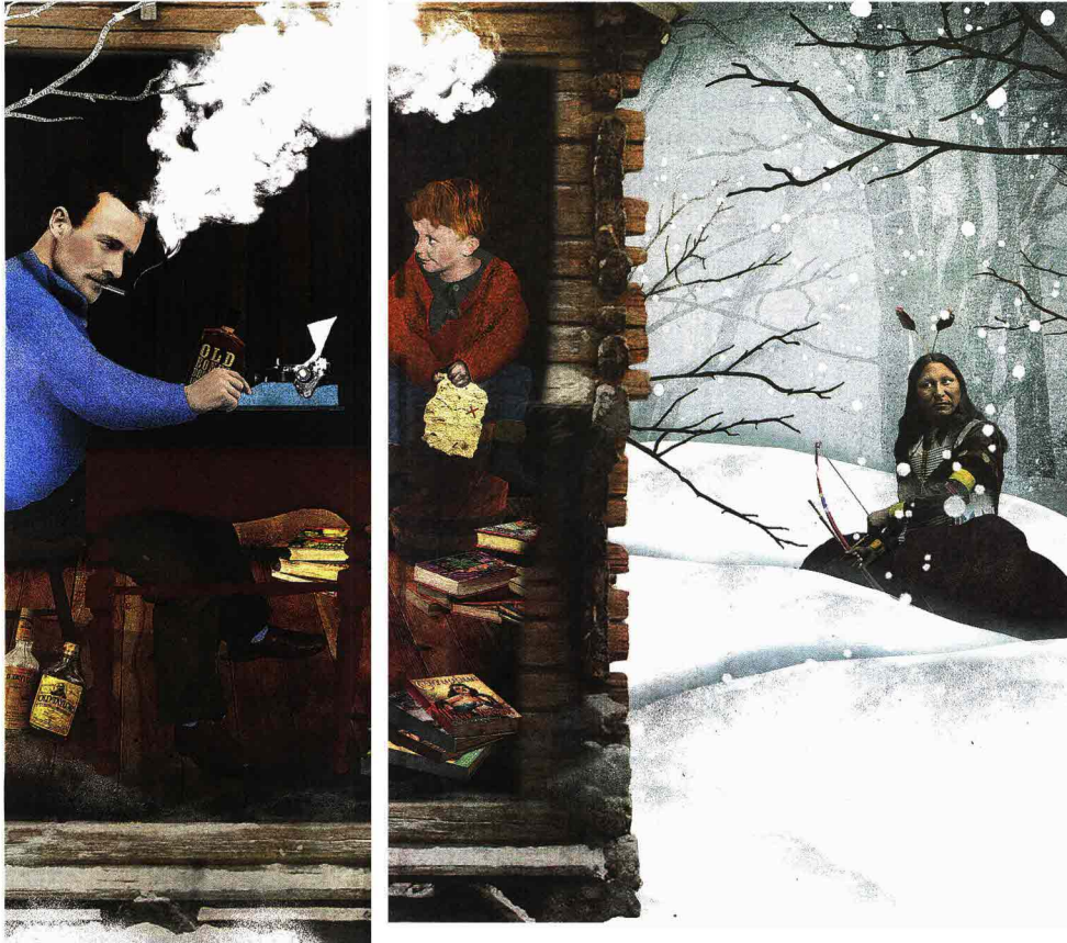
ILLUSTRAZIONE DI FRANCESCA CAPELLINI