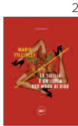
2. La Sicilia è un'isola per modo di dire di Mario Fillioley, Minimum Fax, pag. 150, 14 €.