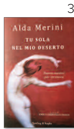
3. Tu sola nel mio deserto di A. Merini, a cura di E. R. Parea, Sperling & Kupfer, pag. 128, 16,90 €.