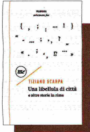
Tiziano Scarpa «Una libellula di città e altre storie in rima» Minimum Fax pp. 104, € 10