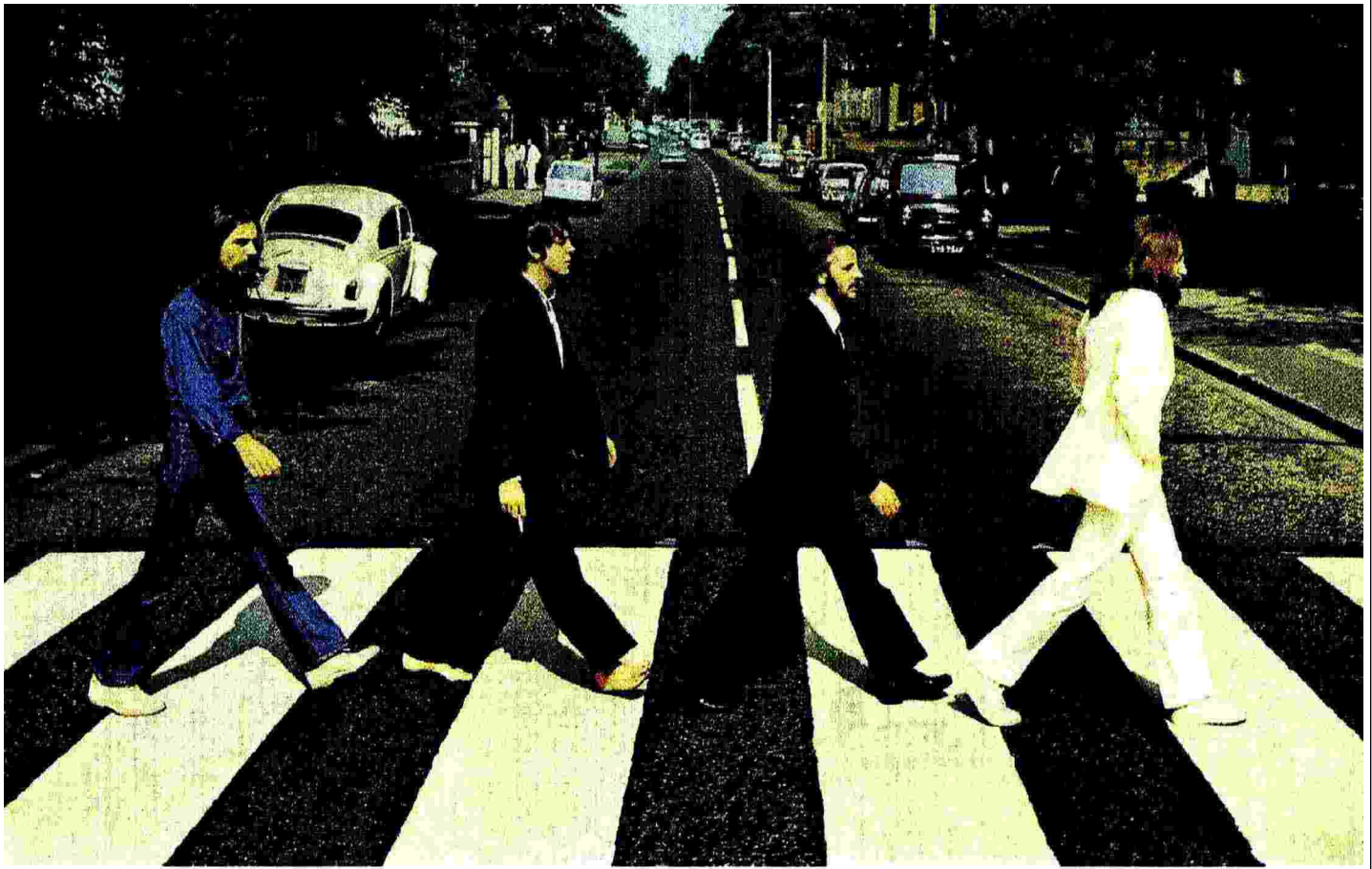
Dove va la musica? La celeberrima immagine dei Beatles sulla copertina dell'album "Abbey Road"