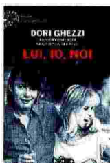
Dori Ghezzi Lui, io, noi EINAUDI PP. 160 EURO 17