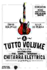
Brad Tolinski Alan Di Perna A tutto volume BOMPIANI PP. 456 EURO 20