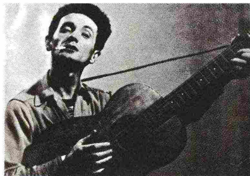
Woody Guthrie (1912 - 1967) negli anni Sessanta

1863 → Viene inaugurata la London Underground, la più antica rete metropolitana del mondo