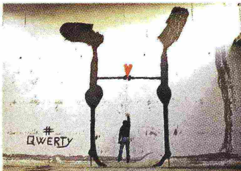
Un'opera di Qwerty, ospite a Cortona

Il centro storico diventa un'immensa tela su cui lavoreranno ventinove artisti provenienti da tutto il mondo. Succede fino al 10 gennaio per Art Adoption New Generation. Lascerà un segno anche lo street artist Qwerty, con i suoi omini stilizzati, ultraromantici portatori di amore.