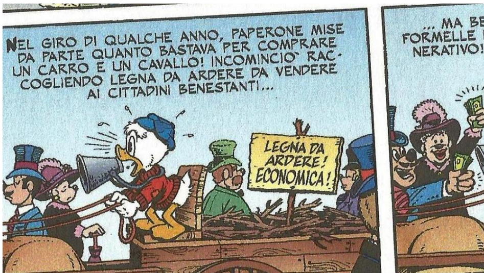
Paperone e l'effetto Veblen

Un libro racconta la generazione di trenta-quarantenni che collezionano lauree, vanno da un lavoro precario intellettuale all'altro e vivono al di sopra delle loro possibilità