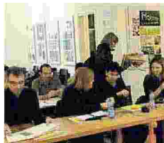
MARCOS Y MARCOS A Milano corsi di editoria