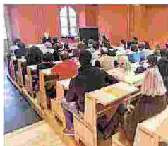
SCUOLA HOLDEN Il 70% dei diplomati ha trovato lavoro