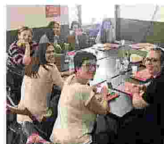
LA SCUOLA DEL LIBRO A Roma sette corsi di editoria