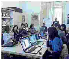
NAVARRA Corsi di editoria per redazione e editing