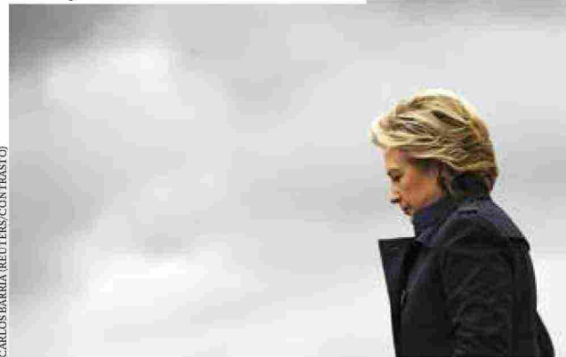
CARLOS BARRIA (REUTERS/CONTRASTO)

che l'hanno definitivamente affossata. Naturalmente anche Donald Trump fa parte della lista. Chi spera di capire cosa è successo non sarà completamente soddisfatto da What happened . È più una ricostruzione personale che un racconto dei fatti, non c'è un vero