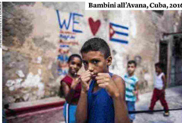
Bambini all'Avana, Cuba, 2016

va a dare risposta ad alcune domande fondamentali: in che condizione sono arrivati i cubani alla fine della rivoluzione e perché hanno perso fiducia in questo progetto? "Le persone e le storie che racconto esprimono alcuni temi fondamentali di oggi: la migrazione, la sanità