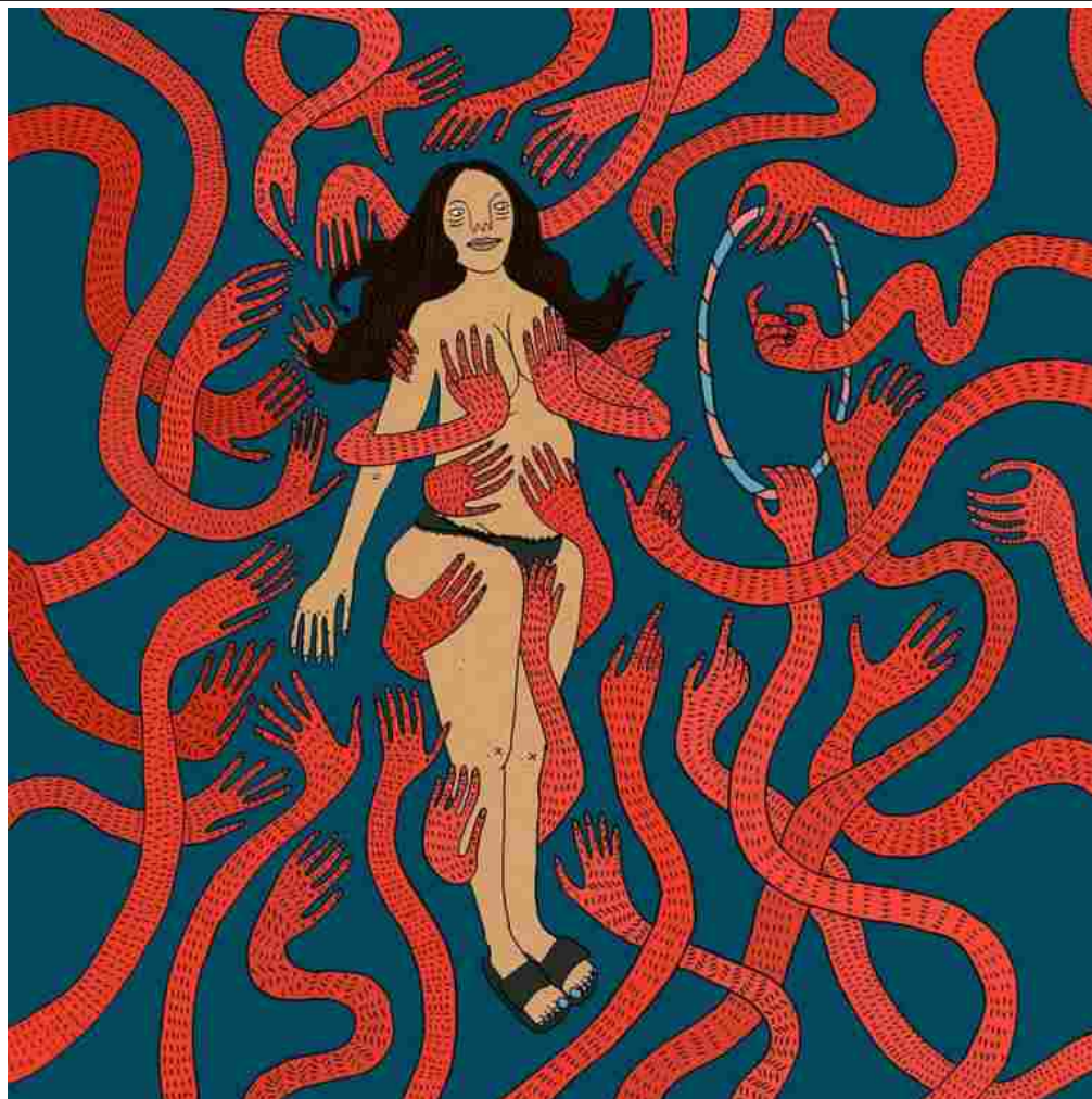
Opera di Polly Nor.