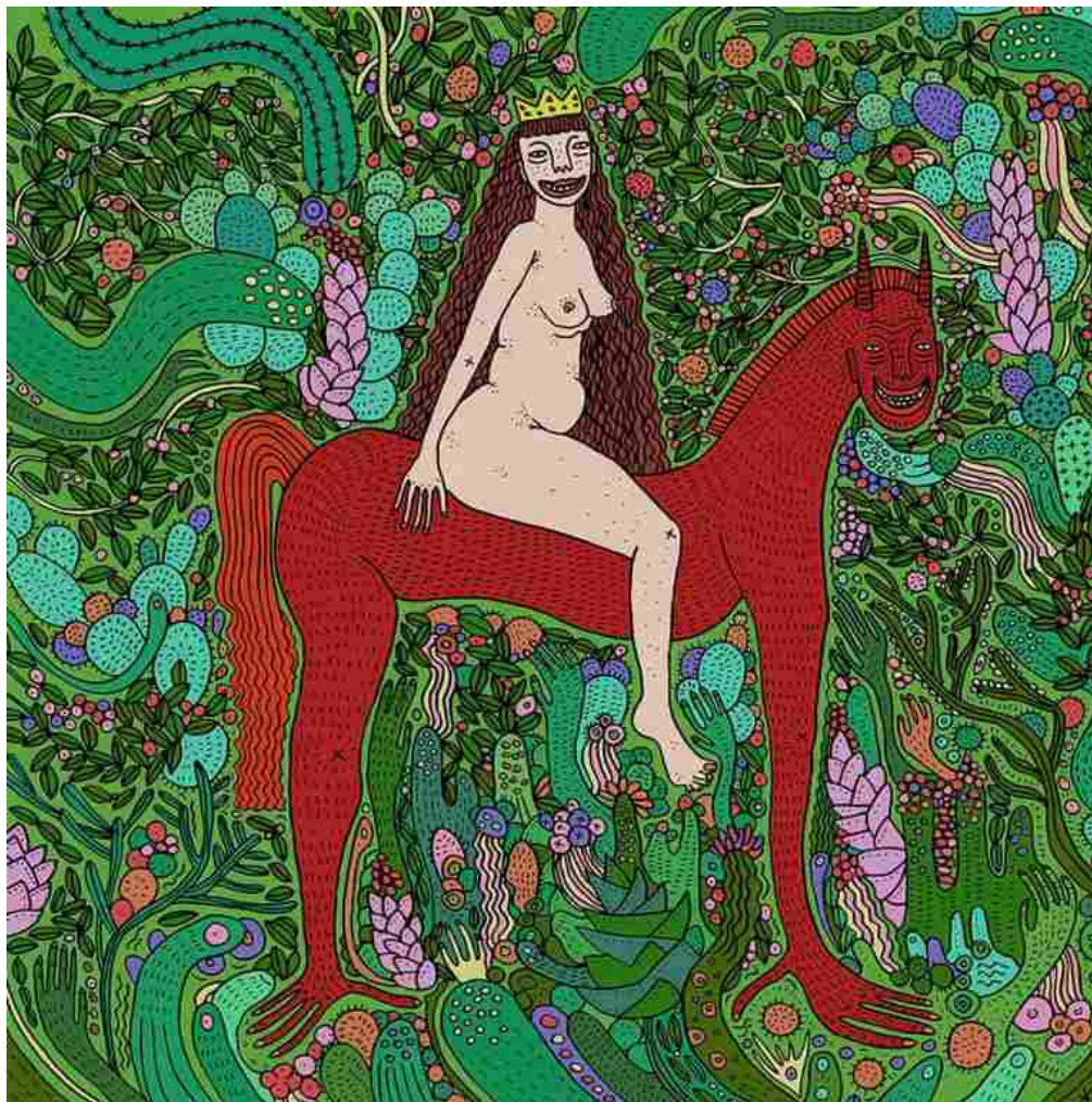
Opera di Polly Nor.

È difficile tirare le fila di questo lungo discorso. Lo stesso saggio di Emily Witt non arriva a nessuna conclusione. Si limita a raccontare il presente e a parlare di noi, nati tra gli anni Ottanta e Novanta, divisi tra la memoria virtuale dei social e una vita fuori da internet. La Witt sostiene che i nostri successori non penseranno a se stessi come uomini e donne, si fonderanno con le macchine della loro epoca. Non avranno imbarazzi né le nostre limitanti idee di autenticità. Quest'idea un po' mi spaventa e spero che non andrà così. Sarà però un nuovo mondo, qualcosa di completamente diverso da come lo conosciamo ora. Riuscire ad accettare ad oggi una simile prospettiva sarebbe come provare a spiegare che cos'è twitter a un uomo di Neanderthal. La società in cui viviamo su tante cose fa paura. Mi interrogo su come potrei spiegare ad un futuro figlio che il sesso che fanno le persone non è quello che propongono i porno. Mi interrogo su come potrei insegnargli a sviluppare uno spirito critico per difendersi dalla rete e da tutte le sue insidie. Però, credo anche che gli direi che in ogni rivoluzione e rottura col passato c'è fermento, gli direi di non fermarsi al perbenismo dei suoi genitori. Gli direi di indagare la strana realtà in cui è capitato per comprenderla, ribellarsi, scrivere un nuovo capitolo.