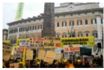
Agricoltori e allevatori terremotati in piazza Montecitorio: 'Meno chiacchiere, più stalle'