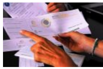
Pagamenti con i voucher in agricoltura. In Umbria numeri da capogiro