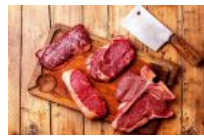
Quanta carne consumiamo in Italia? Ce lo dice l'Osservatorio di Agriumbria