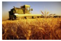
L'eclissi sui fondi europei all'agricoltura