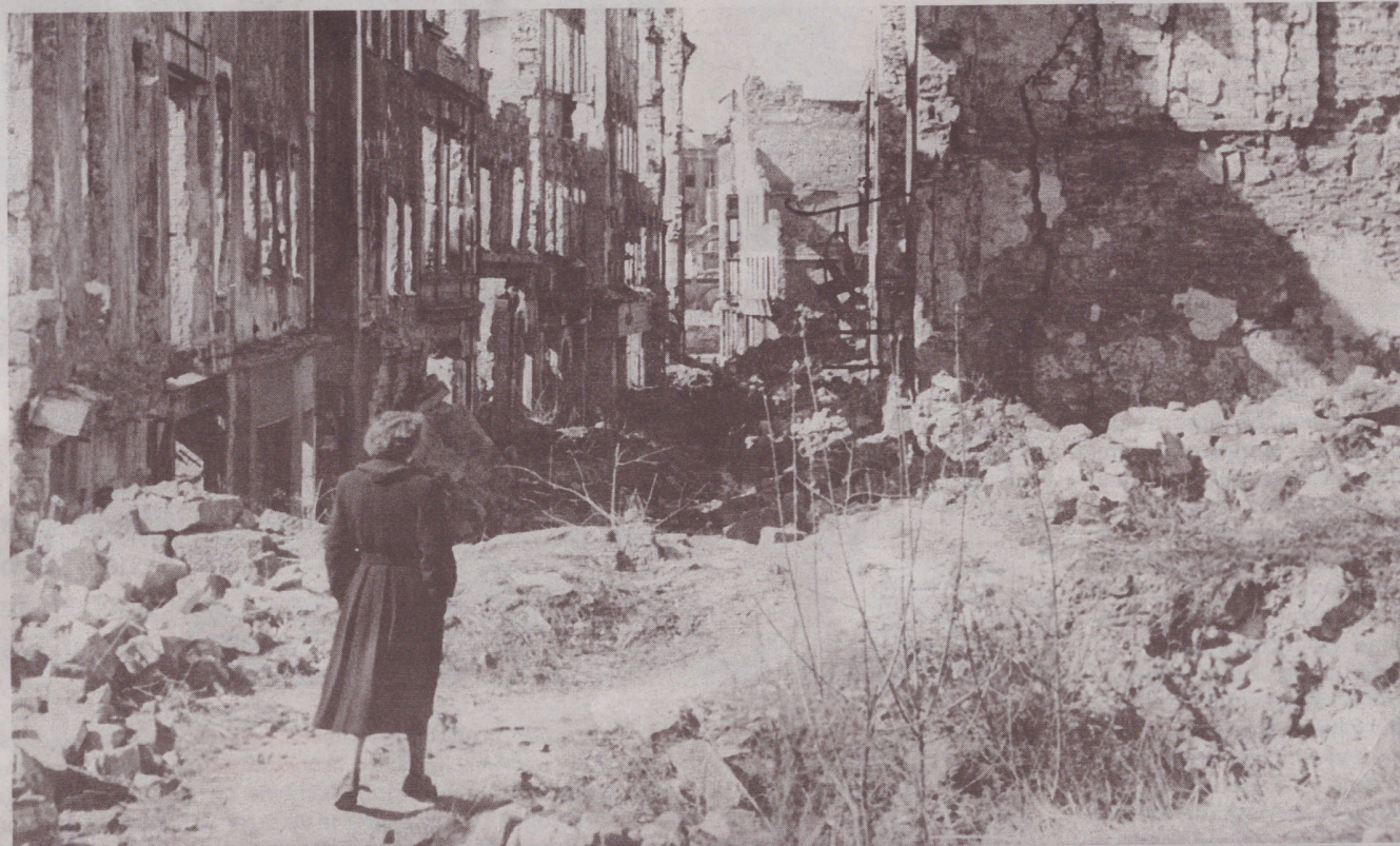
L'orrore di Dresda Il bombardamento della città tedesca che Kurt Vonnegut (1922-2007, foto in basso) raccontò nel suo capolavoro "Matoia n. 5"

ERANATO all'inizio degli anni Venti a Indianapolis, sotto il segno dello Scorpione, dopo aver assistito al bombardamento di Dresda nel febbraio del '45 (cui avrebbe dedicato