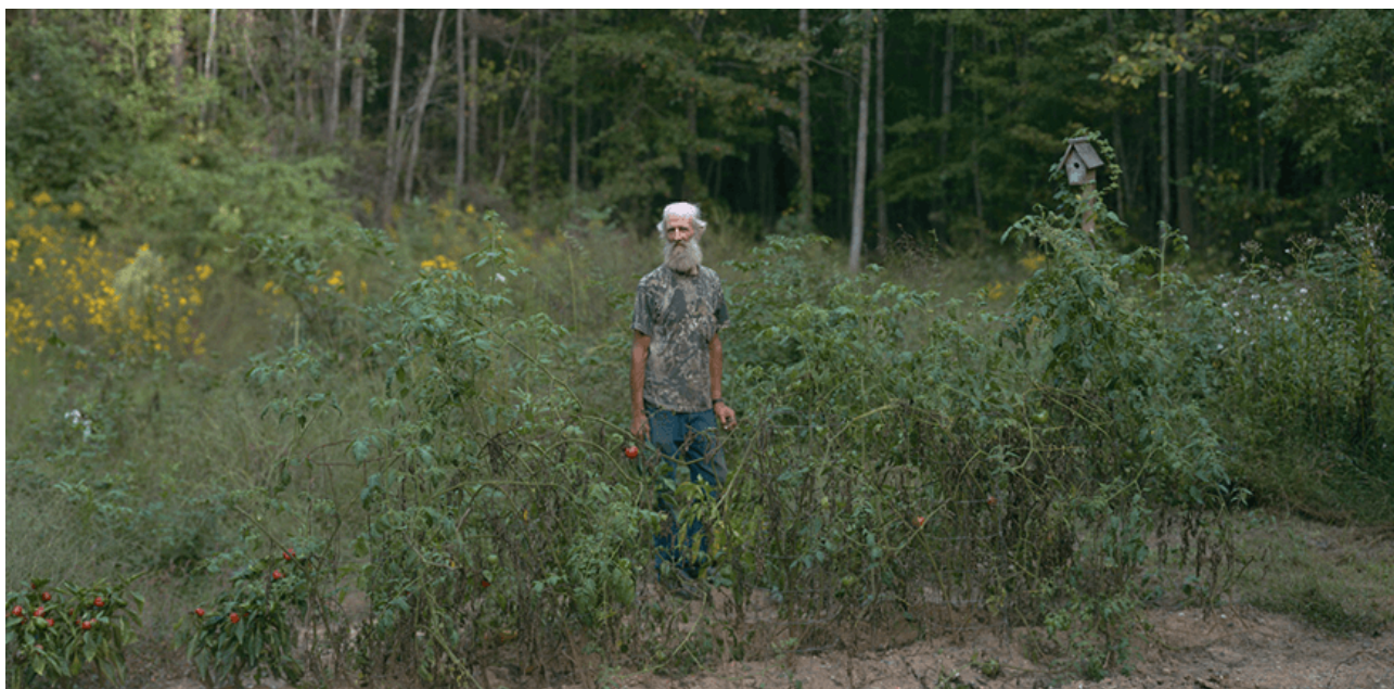
Immagine: Broken Manual, dettaglio.

C'è una cosa che dice Alec Soth nel documentario ed è che la cultura degli Stati Uniti si è rivelata profondamente impreparata al proprio declino, ma quello che vogliono fare questi lavori non è osservare le rovine di un impero; quello che tentano di fare, piuttosto, è ricordare che lo sfacelo non è il modo più autentico in cui le cose si manifestano: che i luoghi esistono, prima di finire. Così questi libri si impegnano a viaggiare in mezzo al niente, per chiedersi cosa accade alle persone che resistono all'erosione del tempo e all'obsolescenza delle cose. Sembra paradossale per opere che parlano di ritiro in sé, ma a guidare queste tre ricerche – pur diverse tra loro – c'è il desiderio di incontrare l'altro, una fame di storie che spinge chi scrive a camminare un po' di più, a muoversi attraverso il vuoto assoluto, a perdersi. In questo modo arrivano a luoghi dimenticati da tutti, scoprono storie differenti, dove il tempo sembra sospeso, capace addirittura di riavvolgersi su se stesso, dove l'isolamento è il risultato della ricerca di un luogo che possa contenere la propria esistenza.