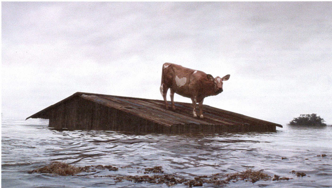
Un'immagine tratta dal film Fratello dove sei? di Joel e Ethan Coen, la storia di tre galeotti in fuga ispirata all' Odissea di Omero.

L'irrequietezza di un uomo, operaio e padre di famiglia, in quel momento amletico che sono i 40 anni, raccontata da un uomo. Un ritratto sincero, nostalgico e struggente (che fa pure ridere)