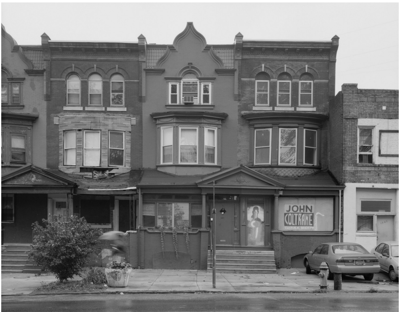
La John Coltrane House a Philadelphia. Negli anni Cinquanta il musicista visse in questo edificio