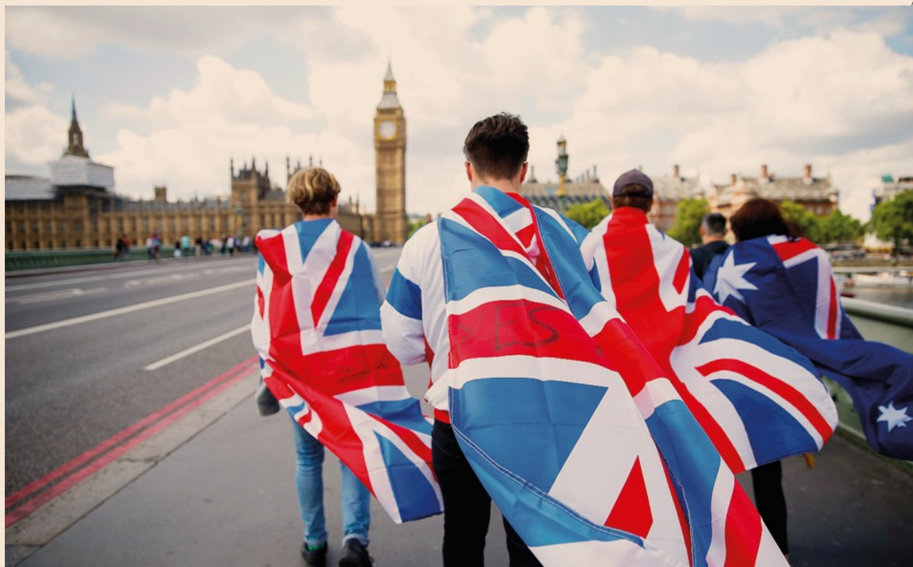
YES PEOPLE | Gente che ha votato a favore di Brexit sul ponte di Westminster

Si tornerà indietro? Difficile pensarlo,