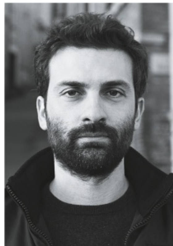
L'AUTORE Alessio Torino

silenziosa e tutti la scambiano per un maschio. Nella comitiva che si crea nell'isola - dove convivono francesi, canadesi e italiani -, giovani e adulti e bambini si mescolano come se nessuno avesse un'età, o tutti la stessa. Ma non è così. Tina, che sa già tutto, ha ancora tutto da scoprire. Ma cosa esattamente scopre Tina quell'estate, in quell'isola, come se Torino, scegliendo quel luogo (l'isola) e quella stagione (l'estate) avesse voluto concentrare la luce in uno spazio che cristallizzasse, o il tempo spendesse? Quando dal cellulare di sua madre Tina scrive al padre se è insieme al «suo nulla» (così la madre chiama la ragazza con cui il marito la tradisce), il padre, da parte sua, risponde: «Sei tu il mio nulla». Ma quella risposta non l'ha letta né la leggerà mai sua moglie ma solo Tina, che ha già cancellato entrambi i messaggi. «Sei tu il mio nulla» il padre l'ha involontariamente detto a sua figlia. È la figlia ad aver accolto quel nulla. Tina è per un momento moglie e figlia nello stesso tempo. Quel viaggio non è una vacanza per lei. Ella scopre in un momento solo che l'amore può esaurirsi; e che esaurendosi è la gioia che scompare. Più esattamente, Tina comprende che gli uomini, e ora lei con loro, sono infelici.