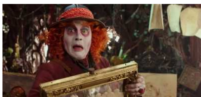
I libri da leggere nel 2016 prima che diventino film