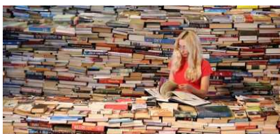
10 cose successe nel 2015 nel mondo dei libri