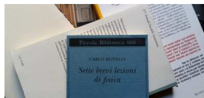
Il caso editoriale dell'anno