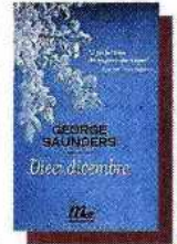
George Saunders «Dieci dicembre» Minimum fax pp. 222, € 15