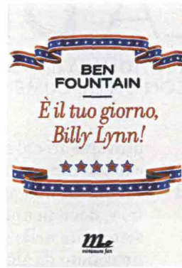
È IL TUO GIORNO, BILLY LYNN! Ben Fountain, minimum fax, pp. 398, 17,00 €

Un giorno qualunque ti guardi allo specchio e non ti riconosci più, e allora vai a comprare le sigarette. È, più o meno, quello che accade a Emilie al momento di servire la cena e festeggiare a lume di candela il suo venticinquesimo anniversario di matrimonio. Un minuscolo incidente la riporta ben più indietro degli ultimi venticinque anni , al suo primo amore; e la nostalgia se la prende. Nostalgia significa desiderio di far ritorno, quindi Emilie molla tutto e ritorna. È facile empatizzare con lei, in questo romanzo on the road; e, a leggerlo, non si è immuni da qualche tentazione di mettersi in viaggio.