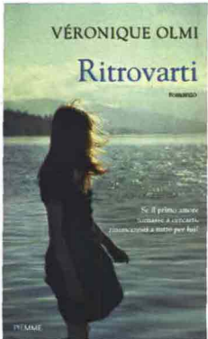
RITROVARTI Véronique Olmi, Piemme, pp. 266, 15,50 €

CON LE MAGIE DI UNA TERRA: GRAZIA VI PROPONE STORIE PIENE DI CONTRASTI DI Valeria Parrella