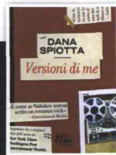
La scrittrice americana Dana Spiotta (47 anni) e la copertina del suo romanzo Versioni di me (minimum fax).