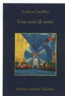
ANDREA CAMILLERI Una voce di notte Sellerio, 2012 pp. 269, euro 4,00