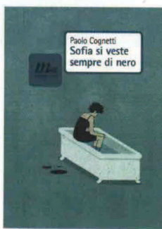
PAOLO COGNETTI Sofia si veste sempre di nero Minimum Fax, 2012 pp. 208, euro 14,00