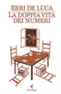
ERRI DE LUCA La doppia vita dei numeri Feltrinelli, 2012 pp. 80, euro 8,00