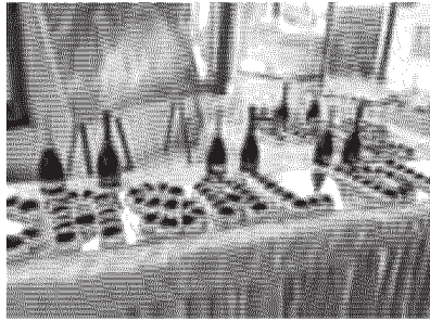
La scommessa Le eccellenze in «vetrina» all'evento di presentazione