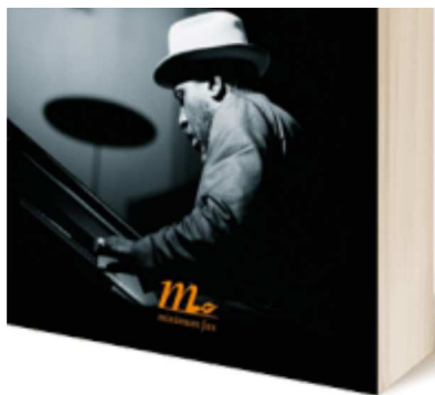
Thelonius Monk – Storia di un genio americano