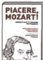
PIACERE, MOZART! di vari autori Edt, 206 pagine, 14,50 euro

Malamud si commosse lavorando alla scena di un romanzo. Bussarono alla porta. Aprì con gli occhi ancora umidi. Nacque così la leggenda che Malamud scrivendo piangeva.