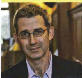
Edmund de Waal, 48

Una collezione di Netsuke, sculture giapponesi di avorio e legno, che si tramanda da generazioni di padre in figlio. Piccole statuine da cui sprigionano storie, personaggi, luoghi. Uno straordinario racconto che attraversa una famiglia, ma anche decenni di vita culturale, tra Parigi, Vienna, Tokio, Londra.