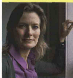
Jennifer Egan, 49

Una scrittura innovativa dove i personaggi principali, un discografico di successo e una sua collaboratrice, sono narrati in racconti che hanno come tema il tempo che scorre, la vita che non è quella che credevamo sarebbe stata da giovani, il tempo vissuto ora. Bastardo, ma pur sempre nostro.