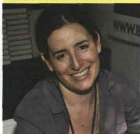
Aimee Bender, 43

Rose è una bimba di nove anni che scopre di avere un dono: sente attraverso ciò di cui si nutre il sentimento di chi ha preparato il cibo: noia, rabbia, senso di colpa e nelle torte di sua madre, all'apparenza felice, tutta la sua disperazione. L'autrice unisce fiaba e realtà in un gioiello di profondità psicologica.