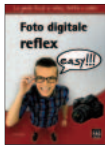
Foto Digitale Reflex