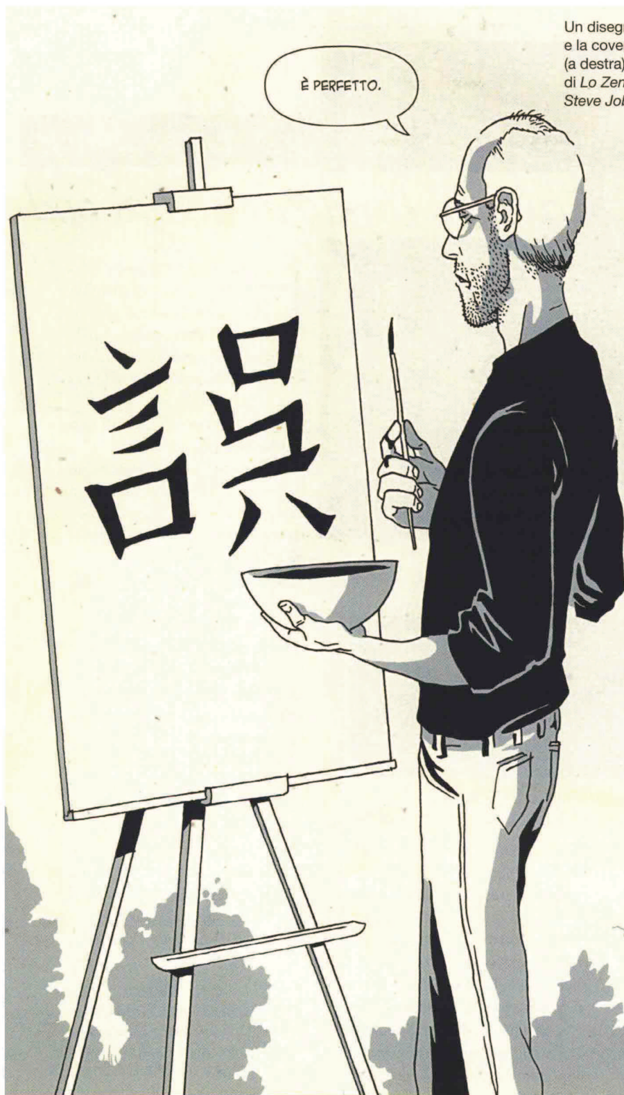
Un disegno e la cover (a destra) di Lo Zen di Steve Jobs .